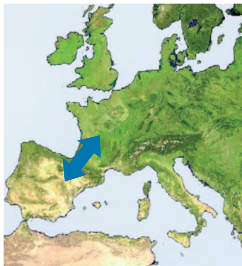
Source : Observatoire des trafics franco-espagnols dans les Pyrénées

À la fois frontalières avec l'Espagne et maritimes, les Landes sont situées sur le corridor que constitue l'axe principal d'échanges entre le Nord et le Sud de l'Europe.